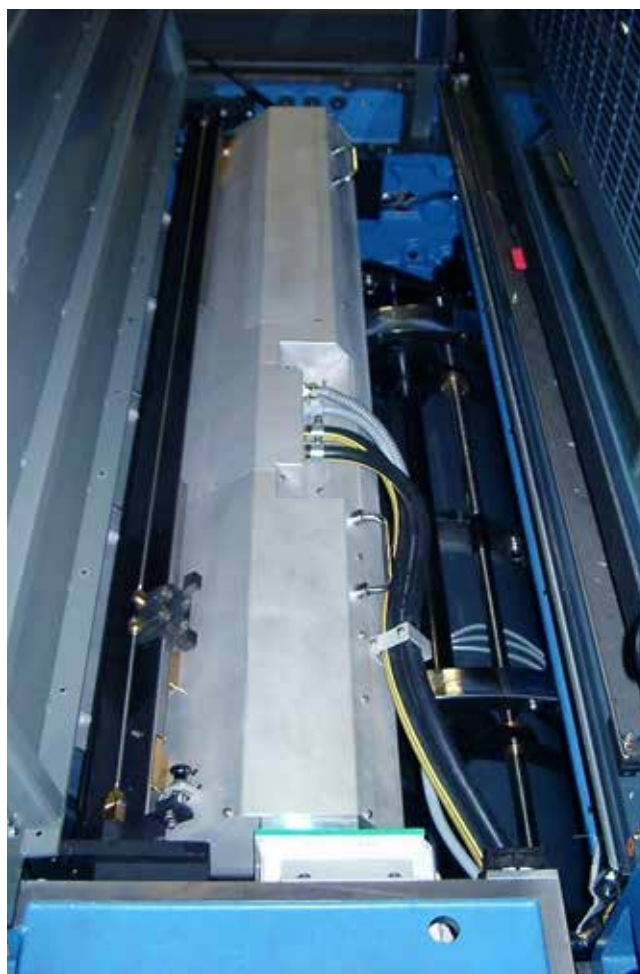
Utwardzanie UV na zespołach drukujących

Andrzej Jabłoński kom: +48 608 072 416 e-mail: andrzej.jablonski@ist-uv.pl www.ist-uv.pl