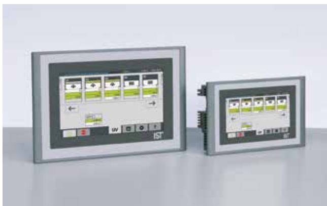
UV User Control Systems Smart Control