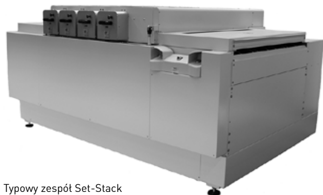
Typowy zespół Set-Stack